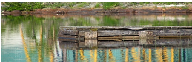
Närheten till naturen är en viktig ingrediens!

Efter tre, sex och tolv månader erbjuds klienten att återkomma för att befästa kunskaper och lärdomar från vistelsen. Återbesöksveckorna stärker det långsiktiga behandlingsresultatet.