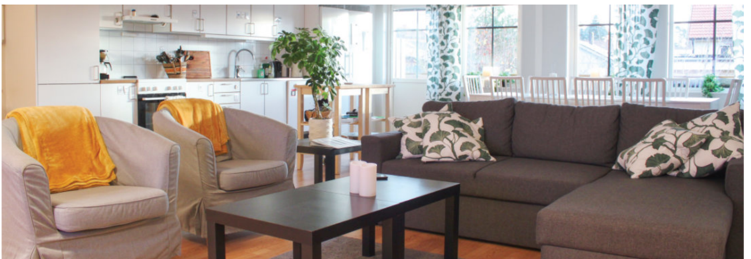
Gemensamhetsyta – vardagsrum, kök och matrum.

stödbehov, öka självständighet och stärka självkänslan. För att öka motivation och delaktighet i vardagen har vi boendemöten en gång i månaden tillsammans med de boende. Där får de bland annat komma med förslag på vardag-, helg- och sommaraktiviteter. Där finns också möjlighet för de boende att lyfta andra frågor och önskemål såsom till exempel inköp och mat.