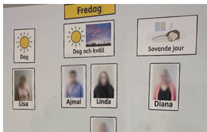
Namn och bild på dag-, kväll- och nattpersonal sitter alltid uppe. De boende vet alltid vilka som arbetar, och när.