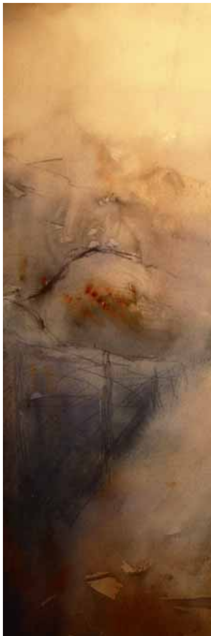
MÅLNING AV MOA GÄLLSTRÖM

”Man ser ju på människan i hela sin miljö. Vem människan är, hur den fungerar i olika situationer och vad den har för utmaningar att stå i, både konstitutionellt, fysiskt, själsligt och andligt. Det där blir ju väldigt tydligt när man lever med pojkarna i vardagen.”