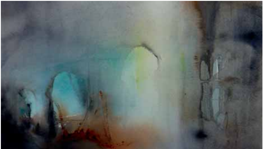
MÅLNING AV MOA GÄLLSTRÖM

Både Lärbo och Linnealunden använder sig av andra mediciner som komplement till den ordinerade konventionella medicinen, detta sker alltid i samråd med läkare. Antroposofisk medicin är ett sätt att hjälpa organismens egen läkning och återställa balansen i kroppens system. Insmörjning eller fotbad kan vara ett bra alternativ vid oro och sömnproblem. Eller örtomslag vid hosta och förkylningar. Hudbesvär kan komma av stress, matsmältningsproblem eller hormonella störningar. I dessa fall kan antroposofiska receptfria mediciner hjälpa till.